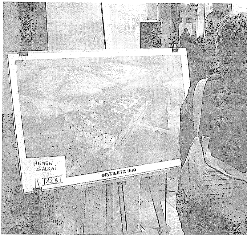
Koloredun margolanak jendearen atentzioa piztu zuen.